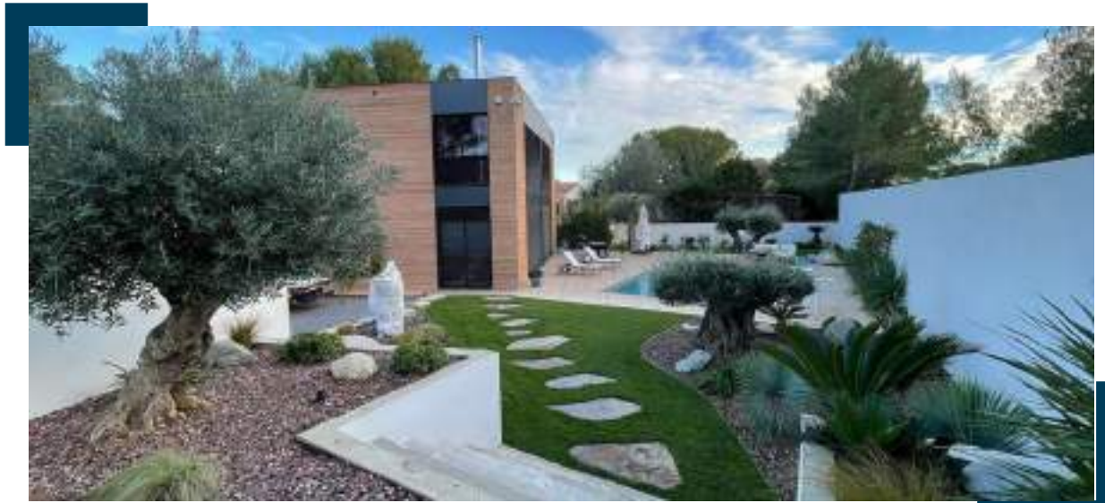
Photos Paysage et Allée

Le terrassement est l'opération permettant de préparer un terrain. Il existe différents types de terrassement (travaux de fouilles, excavation ou remblaiement, terrassement de surface...).