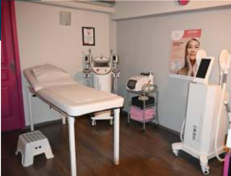
Cabine de soins. Photos Relooking-Beauté-Minceur