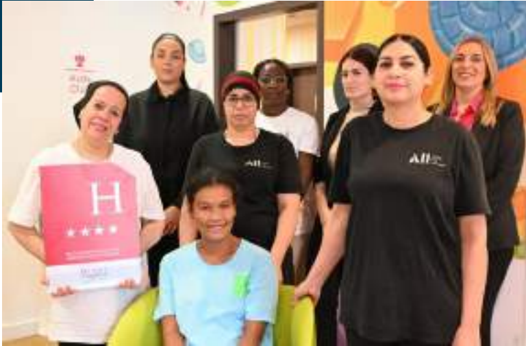
L'équipe de l'Hotel Ibis Style de Montélimar.