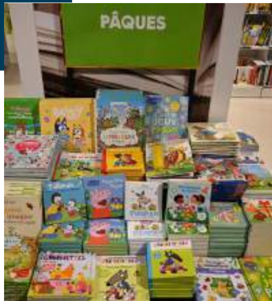
Les livres de Pâques.