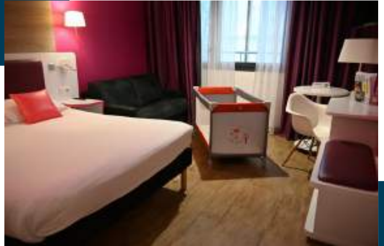
Les chambres peuvent accueillir un lit bébé.