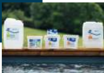
Tous les produits de traitement sont là pour vous aider dans l'entretien de votre bassin.

Ouvert du lundi au samedi de 9 h à 12 h et de 14 h à 19 h.