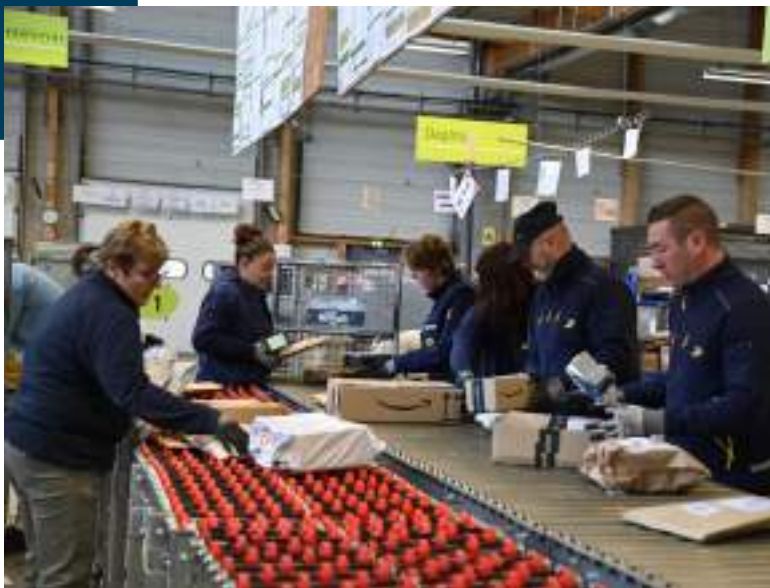
Tri des colis.