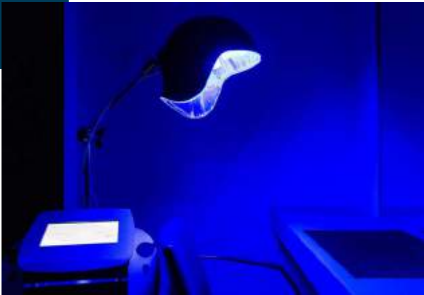
Casque de lumière.