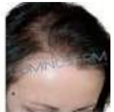
APRÈS 8 MOIS