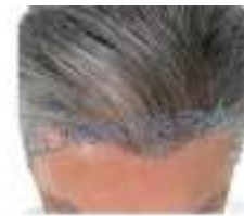
APRÈS 4 MOIS