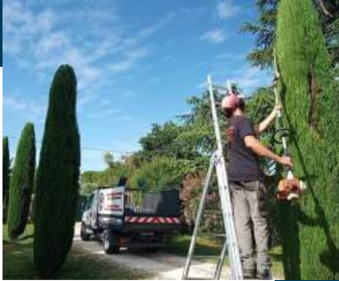
Taille des haies. Photos À Bout de Branche