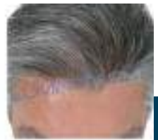
APRÈS 6 MOIS