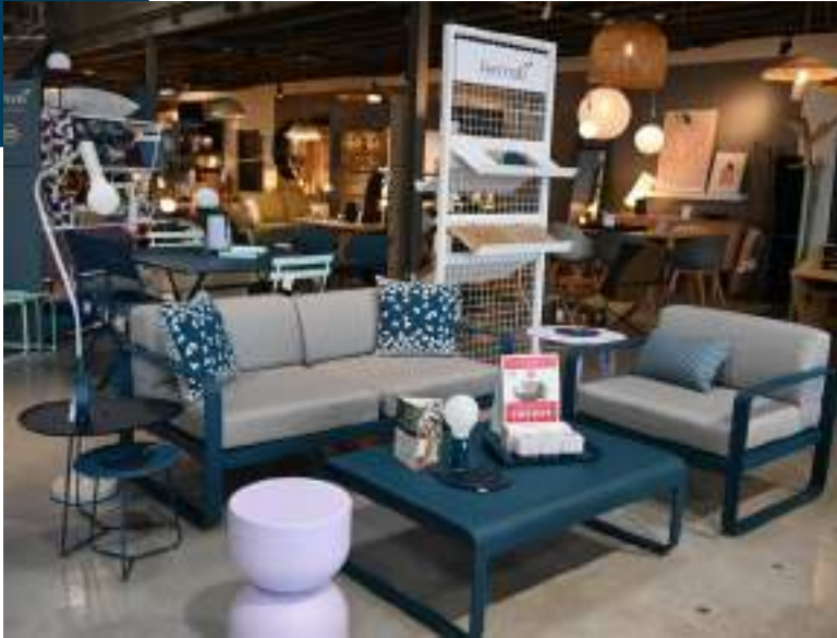
Photos Rez De Chaussée

Rez De Chaussée, magasin de mobilier, décoration et luminaires, est une entreprise familiale qui met son expertise et sa passion à votre service, afin de vous offrir des conseils sur mesures en aménagement intérieur et extérieur.