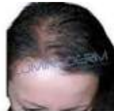
APRÈS 5 MOIS