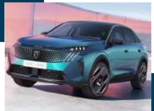
Peugeot 3008.